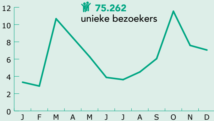
Bezoekersaantallen 2020 website BBZ/BDZ (X 1000)

Tijdens het begin van de eerste lockdown in maart 2020 en de tweede lockdown in oktober 2020 verdrievoudigde het aantal bezoekers van de website ten opzichte van de pre-corona periode.