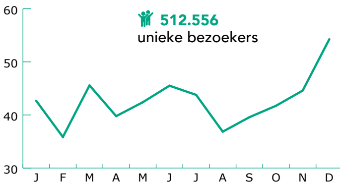
Bezoekersaantallen 2020 website grensinfo.nl (X 1000)

Het aantal unieke bezoekers van de website grensinfo.nl is ondanks de corona pandemie in 2020 licht gestegen ten opzichte van 2019.