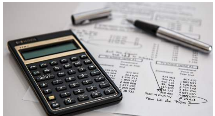
Figuur 2: Een rekentool werd ontwikkeld door POM Oost-Vlaanderen

Om de praktische haalbaarheid van concepten uit te testen werd een aantal pilotprojecten uitgevoerd. Deze pilotprojecten leveren de nodige praktijkervaring en onderbouwen de economische haalbaarheidsstudie. Stalen van biomassa werden opgehaald bij PCG, KUL en AgrAqua en verwerkt op diverse locaties (vb. Vertexco, Ecotreasures). Bedoeling hierbij was vooral om een beter zicht te krijgen op een aantal operationele zaken bij het economische en logistieke verhaal. Zo werden extra droogtesten uitgevoerd om ook een beter zicht te krijgen op marktprijzen. De opgedane ervaringen en het kwantitatief cijfermateriaal, zoals kostgegevens, werden verwerkt in de rekentool.