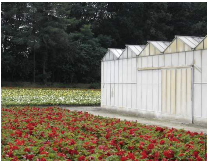
Figuur 1: Leegstaande serres als productielocatie voor Spirulina?

De boodschap is meestal dezelfde. Bedrijven zijn bereid over te schakelen op lokaal geproduceerde Spirulina en/of fycocyanine, op voorwaarde dat het product kwalitatief goed is en wordt aangeboden tegen een aanvaardbare prijs. Een aanvaardbare prijs betekent dat de afnemers bereid zijn een iets hogere prijs te betalen dan het ingevoerde (niet-Europese) product. Hiervoor is het dus nodig om de kostprijs te kwantificeren (die nog niet bekend is tijdens de marktanalyse).